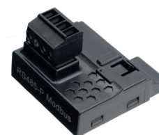
Modbus RS485 P